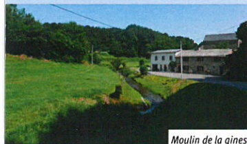
Moulin de la gineste