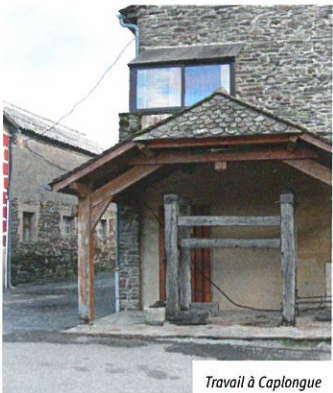
Travail à Caplongue