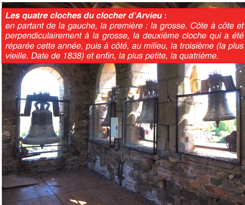
Les quatre cloches du clocher d'Arvieu : en partant de la gauche, la première : la grosse. Côte à côte et perpendiculairement à la grosse, la deuxième cloche qui a été réparée cette année, puis à côté, au milieu, la troisième (la plus vieille. Date de 1838) et enfin, la plus petite, la quatrième.

En 1890, pour perpétuer le souvenir d'une retraite mémorable, il est décidé