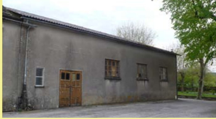
Salle des Tilleuls : une rénovation s'impose !