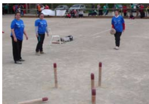
L'équipe féminine d'Arvieu

Renseignements et inscriptions au Cantou par email à cantou.arvieu@gmail.com ou par téléphone au 05 65 46 06 06.