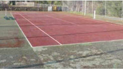
Le 2 ème court de tennis est inutilisable

Lors de l'inauguration de la mairie, M. le Préfet nous a incité à demander des Dotations d'Equipements pour les Territoires Ruraux (DETR). Cinq ont été déposées avant la date limite. Quatre ont d'ores et déjà reçu un accord favorable avec des taux de subvention variables. La 5 ème , concernant la salle R. Almès, nécessite d'autres d'informations.