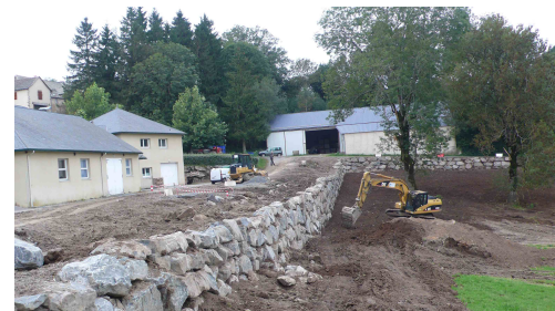
Chantier de Saint Martin des Faux

déplacement de voie dans le village qui sera effectué en octobre. A St Martin des Faux, après la création d'un poste de relevage des eaux usées de la salle des fêtes vers le réseau collectif, un enrochement est en cours de réalisation pour augmenter les possibilités de stationnement dans le village et créer une voie entre la route départementale et la route du lac.