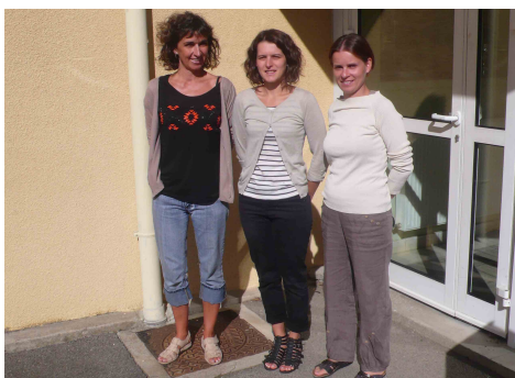
Les institutrices d'Arviu

Bravo aux organisateurs du SIVOM, de l'Office de Tourisme Pareloup-Lévézou et aux bénévoles. Espérons que cette manifestation sera renouvelée.