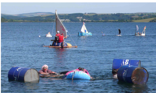
Parade des OFNIs

■ La CUMA a 30 ans : créée en avril 1982 par 26 adhérents pour formaliser une entraide déjà existante sur la commune, la CUMA proposait alors 5 services autour de matériels collectifs (élagueuse, fendeuse, canon d'arrosage, conditionneuse, pulvérisateur). Aujourd'hui, ce sont 86 adhérents qui bénéficient de 75 équipements et d'une trentaine de services répartis sur les trois zones de la commune. Mais la CUMA c'est aussi un lien social fort, des bénévoles et une solidarité favorisée par le fait de travailler ensemble et de se retrouver.