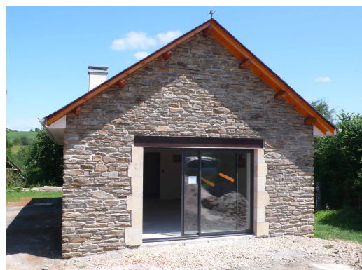
La maison de la chasse