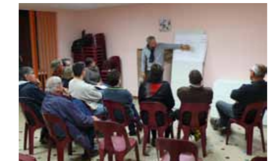
Réunion au sujet de la place du marché

Au cours de la 2ème réunion publique du 19 mars sur ce sujet, la mairie et le cabinet "Fraysinet Conseils et Assistance" ont présenté le projet d'aménagement de la place amendé suite aux remarques recueillies lors de la 1ère réunion. Ce projet a été globalement accepté par les personnes présentes et sa réalisation devrait démarrer en septembre. A noter que le principe d'un sens unique de circulation sur la place a été retenu, au moins à titre d'essai.