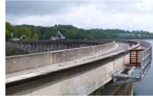
Barrage en travaux

Nous sommes heureux d'accueillir ces 3 nouveaux venus dans l'équipe communale.