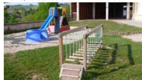
Le nouveau jeu de l'école

sont disponibles au Syndicat d'Initiative, à la mairie, au Cantou et au P'tit Bout d'Où.