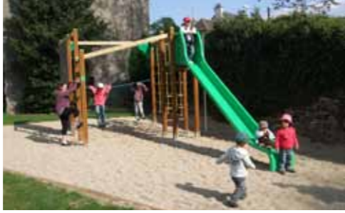
Jeu offert par familles rurales

retrouvent pour une simple promenade ou un entraînement plus musclé. La journée du nautisme qui se déroulera le 15 mai prochain, de 10h à 12h30 et de 13h30 à 17h30 , sera peut-être l'occasion pour certains de se jeter à l'eau. Tel : 05.65.42.93.64. Informations : http://aviron.pareloup.pagesperso-orange.fr/