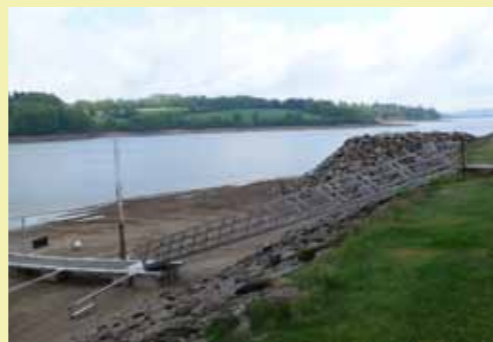
La digue du port a été déplacée